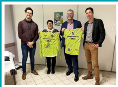
Remise de maillots à la Saunarias.