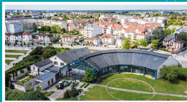
Le Compa, situé à Mainvilliers, ainsi que les Archives et les services administratifs du Département.