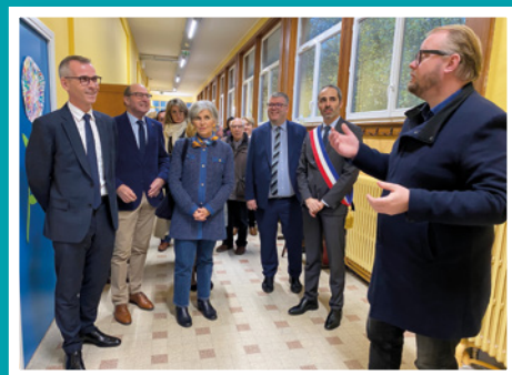
Inauguration de la rénovation de l'école Jules Vallain, à Lèves.