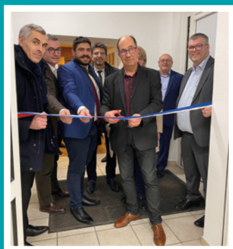
Inauguration de l'agence postale de Sours