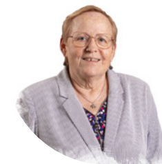
Elisabeth FROMONT Conseillère départementale du canton de Chartres 2