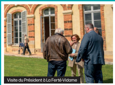
Visite du Président à La Ferté-Vidame