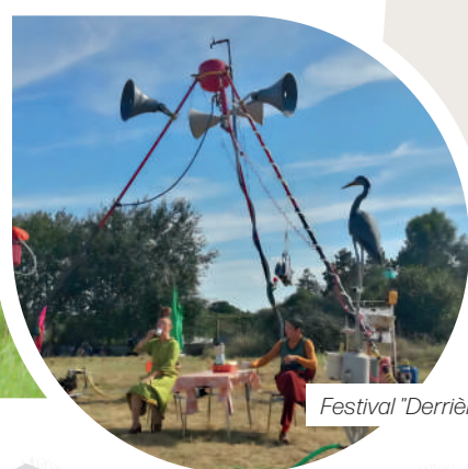
Festival "Derrière les Fagots"