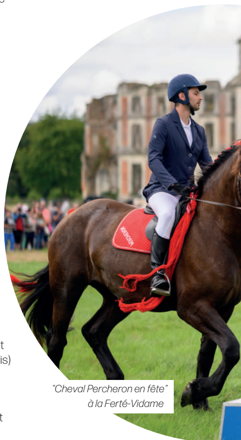
"Cheval Percheron en fête" à la Ferté-Vidame

Première association loi 1901 créée en Eure-et-Loir, l'Avenir Sportif du Thymerais Omnisport (AST Châteauneuf-en-Thymerais) propose de nombreuses activités sportives ouvertes à tous. À ce jour, l'association compte 13 sections sportives et compte environ 1 233 licenciés.