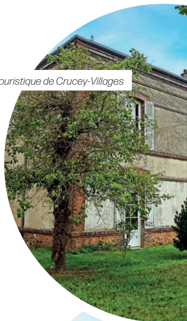
Le gîte touristique de Crucey-Villages

Le Département accompagne la commune de Saint-Lubin-des-Joncherets pour ses travaux d'amélioration de l'accessibilité et du confort de vie des personnes à mobilité réduite . Les communes de Châteauneuf-en-Thymerais et de La Puisaye ont également été soutenues pour des travaux de ce type.