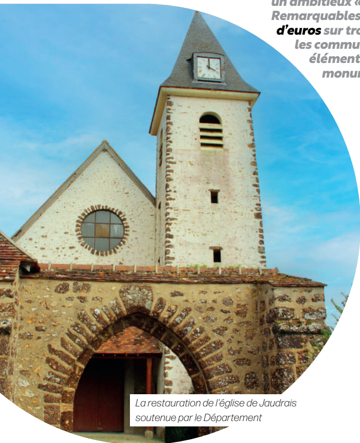
La restauration de l'église de Jaudrais soutenue par le Département

En juin 2022, à l'initiative de Christophe Le Dorven, Président du Conseil départemental, les élus ont adopté un ambitieux « Plan Églises et Petits Patrimoines Remarquables ». Doté d'une enveloppe de 15 millions d'euros sur trois ans, ce dispositif vise à accompagner les communes dans leurs projets de rénovation des éléments de patrimoine : lavoirs, églises, colombiers, monuments aux morts... Voici quelques exemples :