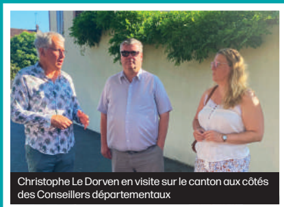
Christophe Le Dorven en visite sur le canton aux côtés des Conseillers départementaux