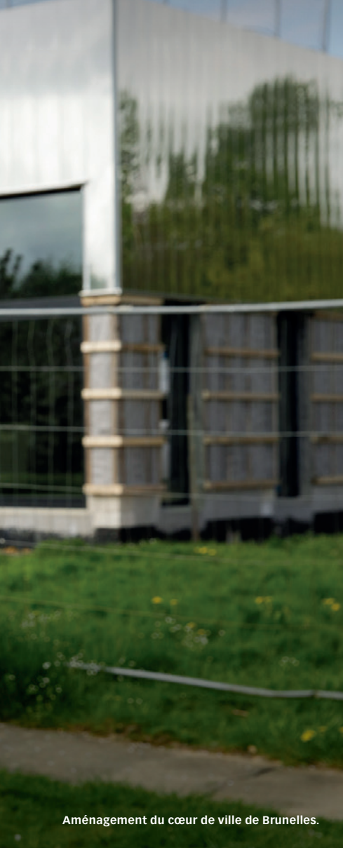
Aménagement du cœur de ville de Brunelles.

Luc Lamirault : Le futur centre d'exploitation routière de La Loupe, de la subdivision du Perche, sera réalisé en 2019. Le gain sera double : nous allons encore améliorer la sécurité routière pour les usagers tout en offrant de meilleures conditions de travail aux agents du Département qui œuvrent sur les axes départementaux de notre canton. Pour cette seconde partie du mandat, nous voulons être particulièrement à l'écoute des demandes des collègues de notre territoire. On prendra acte des besoins formulés pour les différents établissements, pour améliorer les conditions d'accueil des élèves. Je souhaite aussi évoquer l'amélioration de notre offre touristique, vitale pour notre dynamisme. On espère intéresser un opérateur privé pour valoriser les atouts de notre territoire à travers la construction de résidences de tourisme de part et d'autre de notre canton ✕