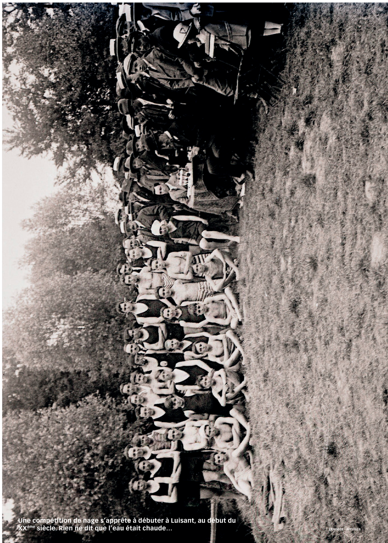
Une compétition de nage s'apprête à débiter à Luisant, au début du XX ème siècle. Rien ne dit que l'eau était chaude...