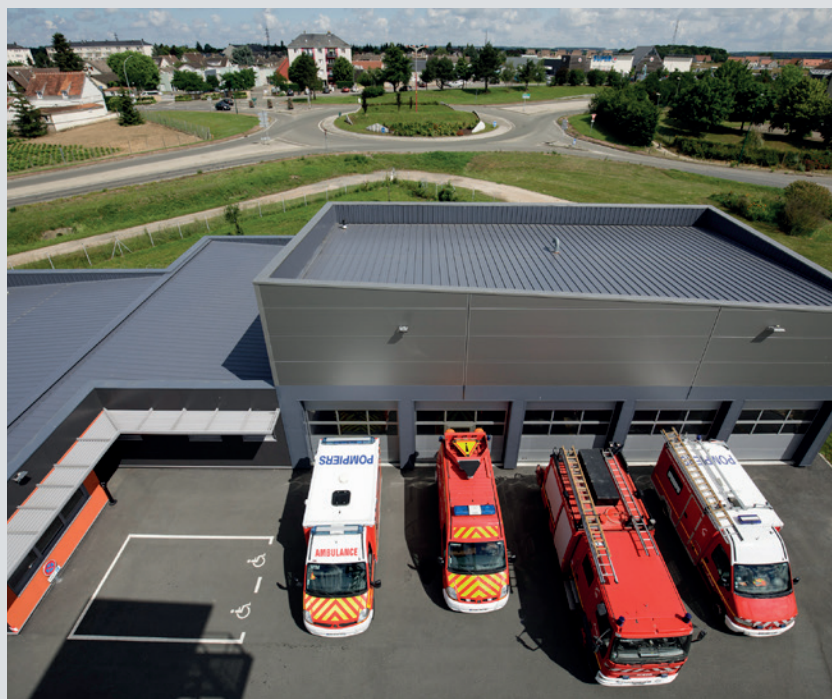
Centre de secours de Courville-sur-Eure.

face au sol de 520 m 2 et d'une cour de 1000 m 2 , a été inauguré en juin 2015. « Il est à la fois plus fonctionnel et plus accessible. Nous avons une tour d'entraînement qui simule les étages d'un immeuble », détaille le capitaine Olivier Proust. « Avant, la maintenance des véhicules ou les manœuvres étaient compliquées, la place manquait et les manœuvres se déroulaient quasiment dans la rue. » Sur ce projet, l'objectif a été d'améliorer l'efficacité des secours pour les Euréliens. « Situé le long de la route départementale 23 de Chartres à Nogent-le-Rotrou, ce nouveau centre permet une mobilisation plus rapide des pompiers », rappelle Laure de la Raudière. « Et nous savons tous que 5 minutes de moins dans le délai d'intervention peut tout changer pour sauver des vies ou arrêter un début d'incendie. » ✕