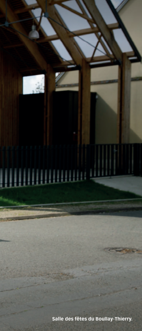
Salle des fêtes du Boullay-Thierry.

Jacques Lemare : Les mobilités sont une priorité, c'est pourquoi d'importants réaménagements vont fluidifier la circulation et le stationnement sur le Pôle gare de Dreux. Le Département investit par exemple 225 900 euros dans un nouveau parking aérien, doté à terme de 400 places, d'une station de gonflage, d'une zone deux-roues et véhicules électriques. Son ouverture est imminente. Le Département apporte également son soutien à la restructuration du théâtre de Dreux, à hauteur de 500 000 euros . C'est un lieu essentiel pour la diffusion de la culture dans le canton, qui va bénéficier d'une remise aux normes et d'un accueil amélioré pour le public comme pour les artistes. J'aimerais souligner qu'en comptant le Très haut débit, les projets achevés et ceux en cours de finalisation, le Département a investi près de 6 millions d'euros sur le canton de Dreux-2 depuis le début de mandat, ce qui a généré 20 millions d'investissement pour les autres collectivités ✕