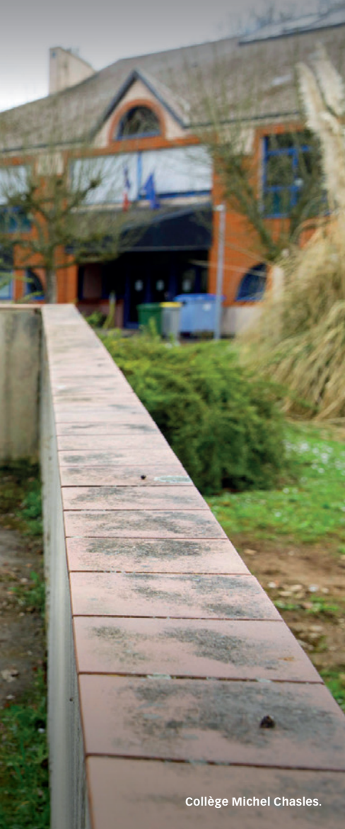
Collège Michel Chasles.

Lormaye et Coulombs vont reprendre dans les mois à venir. L'objectif sera de relier la RD4 (Coulombs-Épernon) à la RD 116 (Chandelles). Le chantier devrait durer 18 mois. Ensuite, les travaux auront pour objectif de relier Coulombs à Lormaye. Le franchissement de l'Eure terminé, il ne restera plus que la troisième tranche à réaliser : la prolongation du contournement jusqu'à la RD 21 (route qui relie Coulombs à Faverolles). C'est un projet indispensable pour le développement des communes concernées. Nous allons le mener à son terme avec pour objectifs : la tranquillité des riverains, le développement économique et l'aménagement du territoire. Pour optimiser encore les axes de circulation du canton, une autre déviation sera réalisée dans la foulée : celle des communes de Hanches, Épernon et Saint-Martin-de-Nigelles. Moins de circulation dans nos petites communes, c'est un gain de tranquillité pour les habitants améliorant leur cadre de vie. Ces investissements renforcent l'attractivité des communes et participent au développement économique ✕