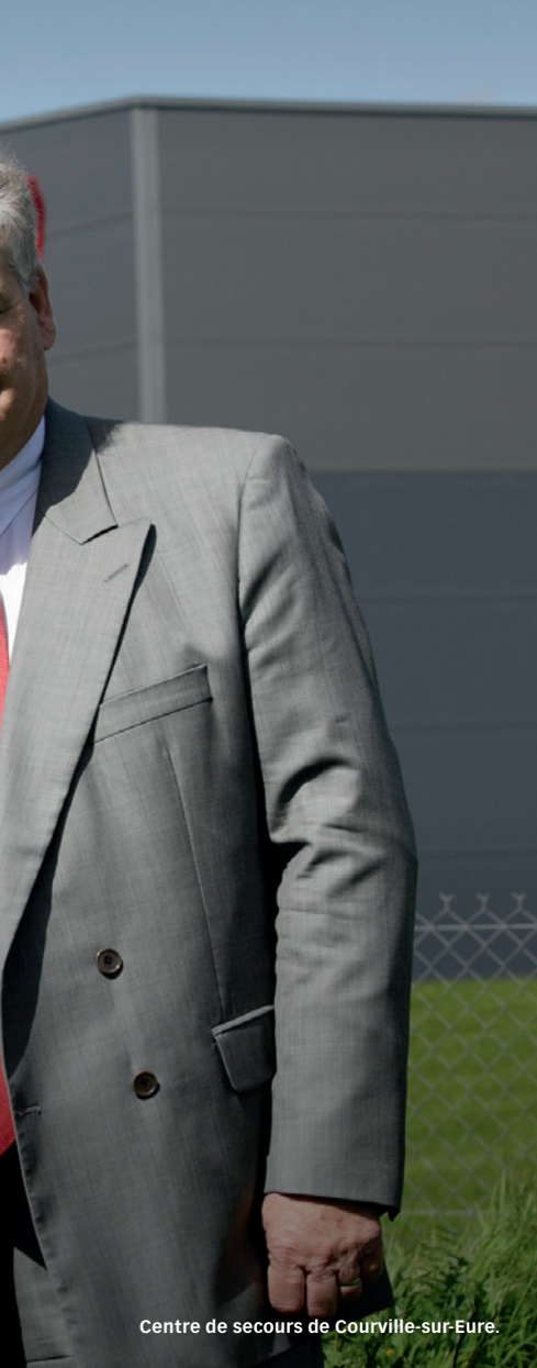
Centre de secours de Courville-sur-Eure.