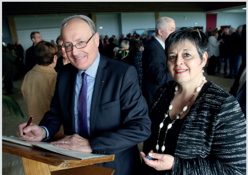
Lors de l'inauguration de la salle multi-activités, place du Château.

La nouvelle salle multi-activités est située à 100 mètres des enfants du groupe scolaire, utilisateurs réguliers de ce nouvel espace. « Les classes des élèves étant installées dans les communs du château, la salle multi-activités permet à ces derniers, de la maternelle au CM2, d'accéder à un lieu dédié pour pratiquer des activités physiques et culturelles ». Ce n'est pas tout : plusieurs assistantes maternelles installées sur la commune disposent d'un créneau pour que les petits fassent connaissance et jouent ✕