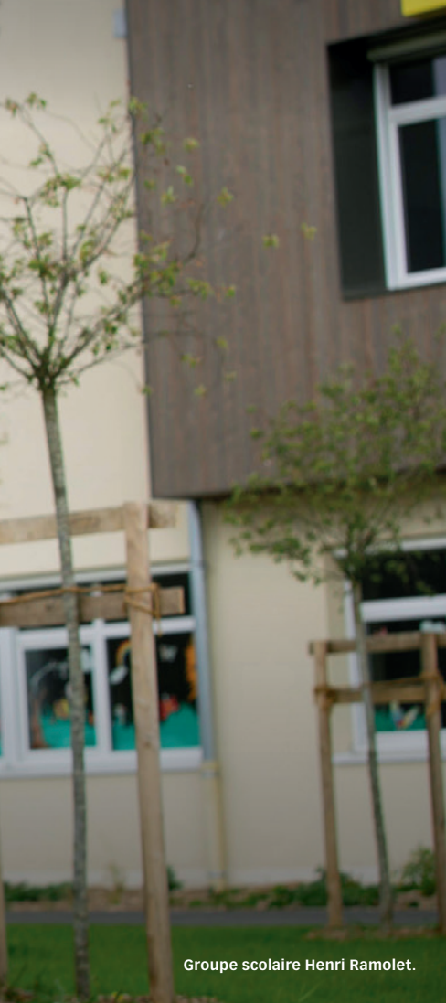
Groupe scolaire Henri Ramolet.

dité indispensable de la RD10 au niveau du centre commercial.