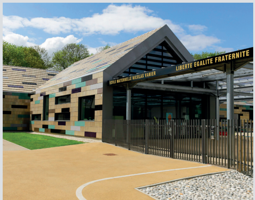
École maternelle Nicolas Vanier.

Le coût total de l'opération qui comprend le groupe scolaire de seize classes, les aménagements extérieurs, le restaurant scolaire et un espace complet dédié à la petite enfance s'élève à 8 100 000 euros, dont près de 750 000 à la charge du Département. Non loin de là, une nouvelle résidence Eurélias de vingt-deux logements dont quinze destinés aux seniors et aux personnes à mobilité réduite, dont la création a également été financée par le Département, rend le voisinage de l'école encore plus attractif et vivant, symbole du « vivre ensemble » ✕