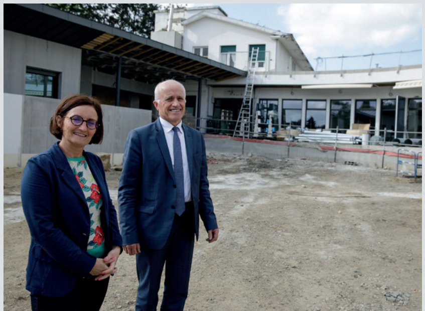
L'établissement pour personnes âgées de Senonches.

travaux ». Un réaménagement dit « en tiroir » permet à la Résidence Périer de rester en activité tout au long des travaux et de mener à bien sa modernisation. « À l'heure actuelle, différents profils de résidents sont mélangés dans les bâtiments. La réorganisation va permettre par exemple la création d'une unité Alzheimer dédiée qui permettra aux résidents comme au personnel une amélioration du quotidien », explique la directrice. « Nous aurons également des chambres équipées de rails pour les pensionnaires les moins mobiles ». L'aspect extérieur de la structure, que l'on aperçoit de la rue, va évoluer. « Avant nous avions un grand parc à l'entrée du bâtiment, sur lequel une aile de l'Ehpad va être construite. Les espaces verts seront eux recréés de l'autre côté. » Lorsque l'Ehpad de Senonches sera achevé, la directrice fera face à un autre défi : coordonner une modernisation similaire dans la maison de retraite de Brezolles, dont elle est aussi la directrice ✕