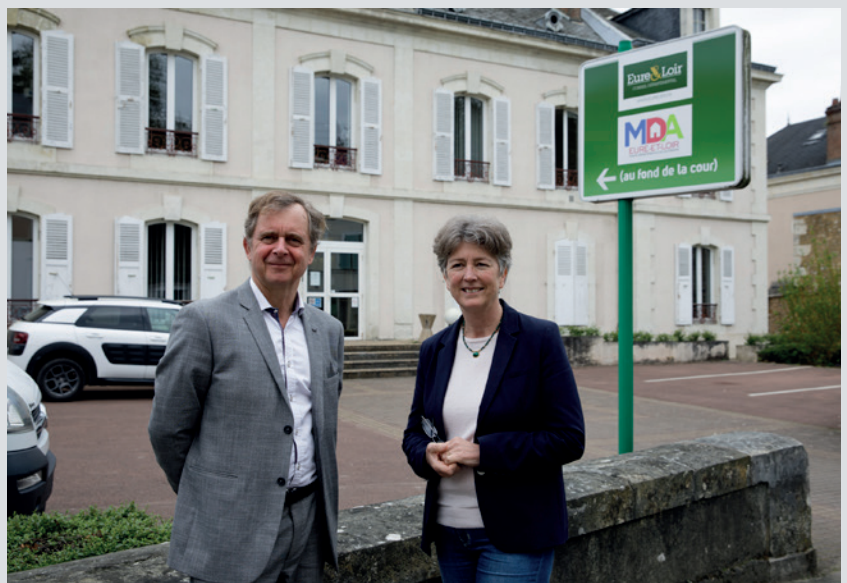
Maison départementale des solidarités de Nogent-le-Rotrou.

Deux salles de rencontres pour effectuer les visites parents/enfants ont été installées, permettant une permanence du lieu et des jouets favorisant des repères stables pour les enfants en bas âge mais aussi pour les adolescents. Deux bureaux d'entretien supplémentaires ont été aménagés pour l'accueil du public ainsi qu'une salle différenciée dédiée aux familles d'accueil. Un nouvel espace de consultation est à la disposition du médecin PMI et de la sage-femme, ainsi qu'une permanence infirmière/puéricultrice. L'accès a été en outre amélioré, via un parking sécurisé pour les véhicules de service avec un portail fermant à clé libérant ainsi le parking devant le bâtiment pour l'accueil des usagers ✕