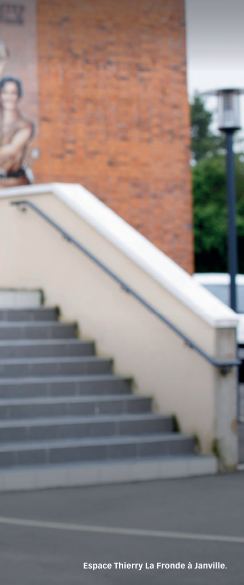
Espace Thierry La Fronde à Janville.

être prêtes à s'installer sur le canton une fois cet aménagement routier réalisé. En tant qu'élue, je suis aussi fière d'aider les associations de notre territoire. Je pense au Club loisirs d'Intréville, commune de 120 habitants, qui prépare quinze jours de festivités pour le centenaire du 11 novembre 1918, au travers de la figure du premier clairon à avoir sonné l'armistice, originaire de la commune. Le passé historique de l'ancien canton d'Orgères est aussi mis à l'honneur avec le Musée de la Guerre 1870, entièrement rénové à Loigny-la-Bataille. Nous voulons accueillir davantage d'événements fédérateurs, comme l'été dernier à Toury : un week-end 100 % handball, parrainé par le champion du monde Valentin Porte et le concours départemental des Jeunes Sapeurs-Pompiers. Pour apporter un meilleur service aux habitants séduits par notre territoire, nous avons aussi programmé d'importants travaux au collège Gaston-Couté de Voves à hauteur de 5,6 millions d'euros afin d'adapter sa capacité au nombre d'élèves et de moderniser les équipements informatiques ✕