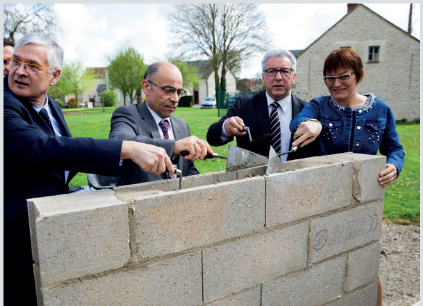
Pose de la première pierre de la maison de santé des Villages-Vovéens.

L'ouverture des portes du nouvel ensemble, qui sera situé en cœur de village au 12, rue de Châteaudun, interviendra d'ici la fin du deuxième trimestre 2019. « Pour accueillir les praticiens, il y aura 1000 m 2 de surface répartis sur deux niveaux. L'accès sera facilité grâce à un parking adapté aux personnes à mobilité réduite ». Au rez-de-chaussée on trouvera médecin, infirmier, kiné, psychologue et orthoptiste (soin des troubles visuels). À l'étage, une clinique dentaire accueillera un chirurgien-dentiste et un orthodontiste. Mais ce n'est pas tout : une nouvelle maison de santé pluridisciplinaire va également voir le jour à Toury, pour le 1 er trimestre 2019. Elle sera située avenue du Pavillon en cœur de bourg ✕